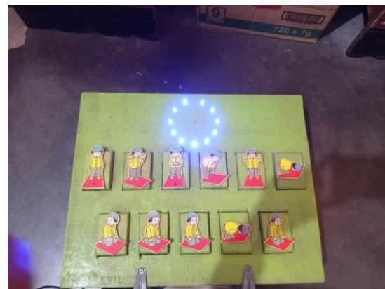
Gambar 2. Hasil akhir media